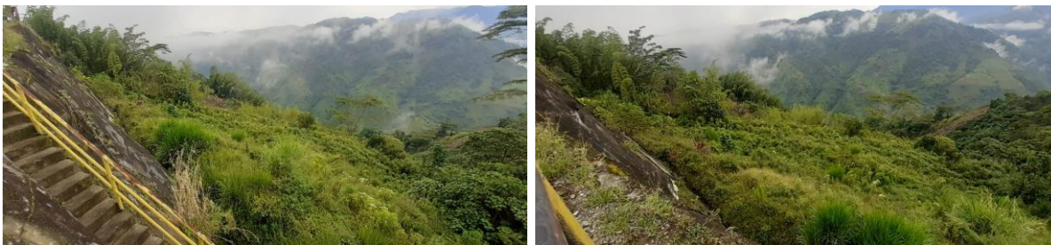
ATG en buenas condiciones.