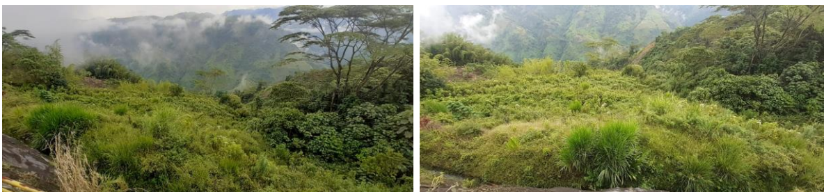
Zona revegetalizada de manera natural.