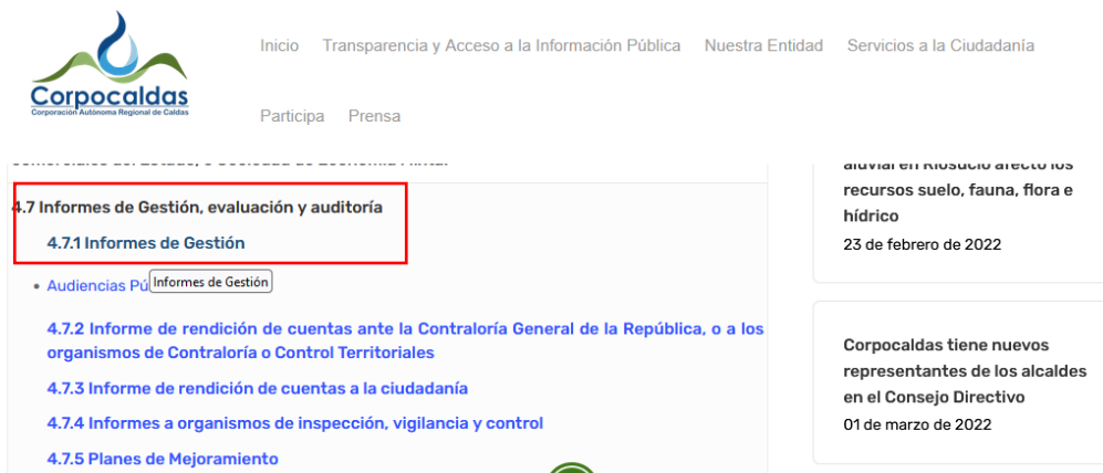
Pantallazo página web Corpocaldas, 2023