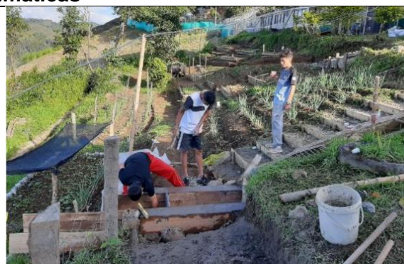
Figura 2 Institución Educativa El Socorro Viterbo