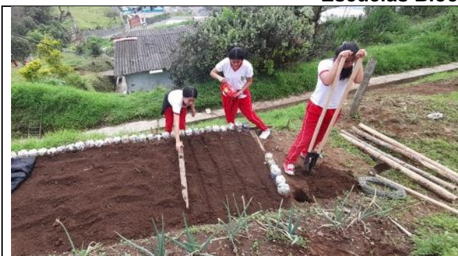
Figura 1 Institución Educativa Hojas Anchas Supia