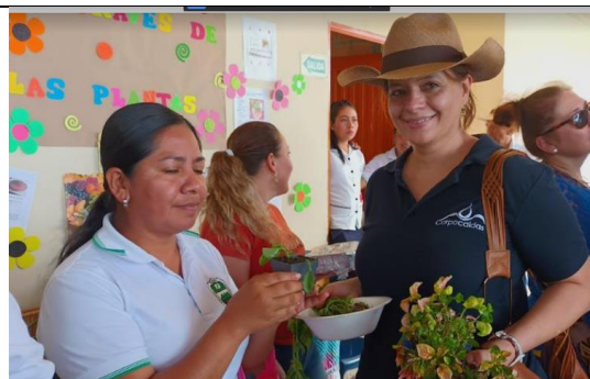
Figura 6. Mercado Campesino (intercambio saberes culturales) Riosucio