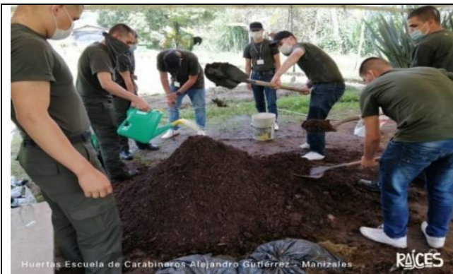
Figura 3 Escuela de Carabineros Alejandro Gutiérrez Manizales