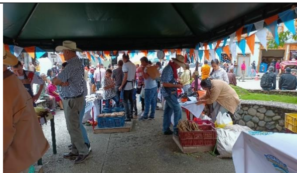
Figura 5. Mercado Campesino Aguadas