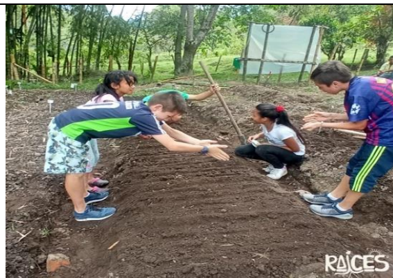
Figura 4 Fundación Creando Historia Villamaría