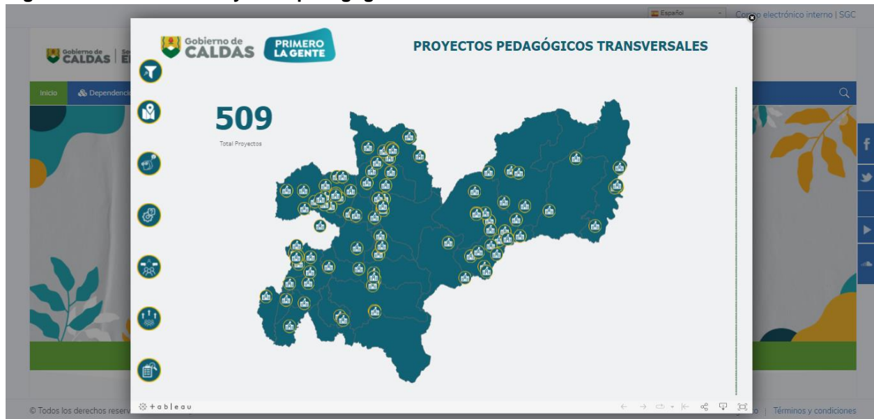
Figura 1: Dashboard Proyectos pedagógicos transversales

En este sitio web se logra identificar cada institución registrada con los proyectos que maneja, incluidos los PRAE, con su descripción, propósito, metodología, la población beneficiaria, además de su interrelación con el PEI. Esta es una herramienta de acceso libre y su dominio es de la Gobernación de Caldas, como se puede apreciar en la siguiente imagen: