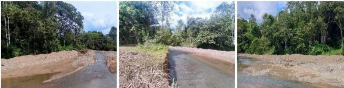
Estado del sector, registrado en el oficio No. 2023-IE-00002234.

En este informe técnico se menciona que los jarillones están generando que el flujo de la corriente se concentre sobre la margen izquierda, afectando la orilla, ya que se están incrementando los procesos erosivos. Es importante precisar que intervenciones como las realizadas, deben ser previamente concertadas con los propietarios de predios de ambas márgenes del río, teniendo en cuenta consideraciones técnicas relacionadas con la geomorfología fluvial propia de este tipo de corrientes, a fin de elegir la mejor ubicación, longitud y magnitud de este tipo de estructuras.