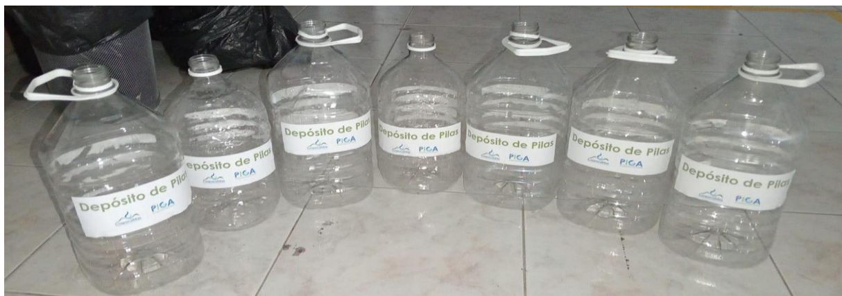
Imagen 4. Contenedores residuos de Pilas Edificio Atlas