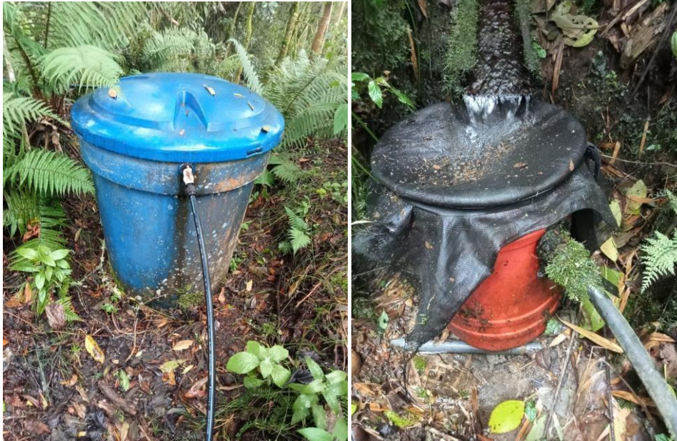
Imagen 5 y 10. Captación de agua en Torre IV

Por último, se solicita información al operario del predio Torre IV respecto a la captación de aguas para tener un contexto del sistema hídrico.