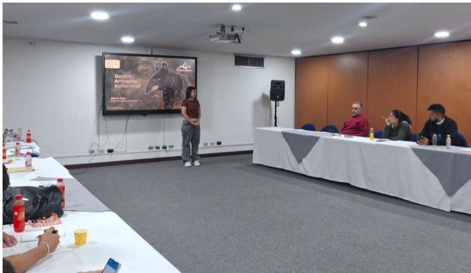
Imagen 7. Reinducción a técnicos de municipios sobre Gestión Ambiental Institucional.