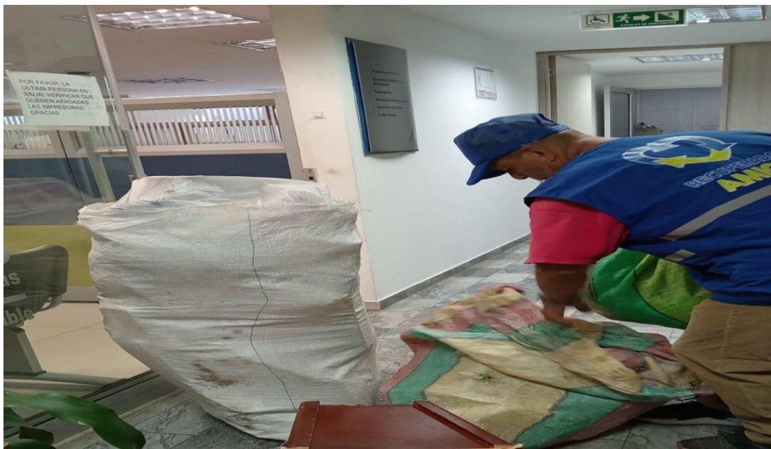
Imagen 1. Recolección de Residuos Sólidos Aprovechables.

En el mes de junio se realizó la primera jornada posconsumo del año liderada por la ANDI en Manizales y otros municipios de Caldas; las sedes que aportaron con residuos posconsumo como RAEE (Residuos de Aparatos Eléctricos y Electrónicos), baterías, luminarias y medicamentos vencidos fue el Edificio Atlas, La sede de atención al usuario y la Reserva forestal Torre IV. A continuación, se muestran evidencias y cantidades entregadas a la red de gestores posconsumo.