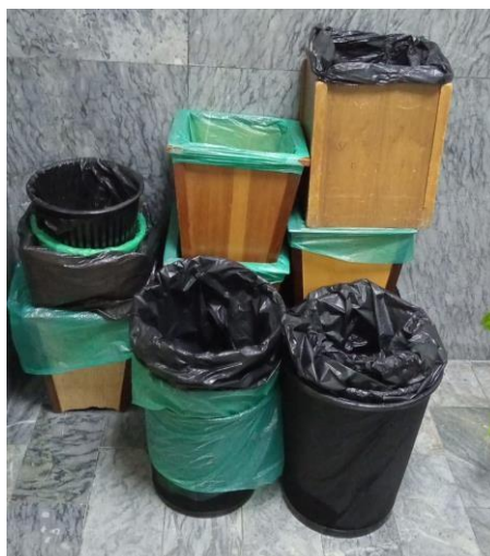
Imagen c. Cestas recolectadas Edificio Atlas

Durante mayo y junio se empezó con la reducción de cestas metálicas y bolsas plásticas en el Edificio Atlas en aras de cumplir con la ley 2232 del 2022; asimismo, se empezaron a crear contenedores específicos para cada piso.