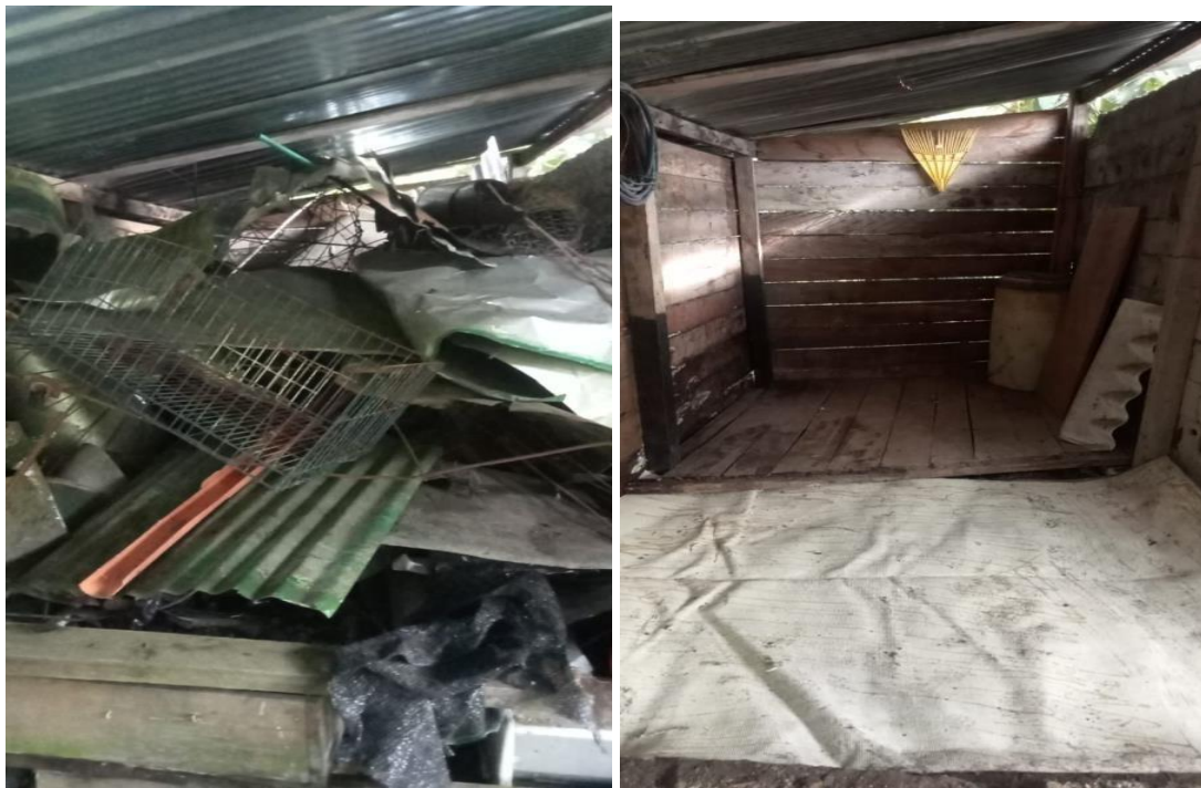
Imagen 5. Antes y después de gestión de chatarra bodega Torre IV.

Durante mayo y junio se empezó con la reducción de cestas metálicas y bolsas plásticas en el Edificio Atlas en aras de cumplir con la ley 2232 del 2022; asimismo, se empezaron a crear contenedores específicos para cada piso.