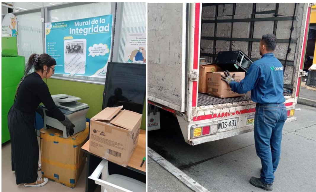
Imágenes 2 y 3. Recolección y entrega Residuos posconsumo Sede Atención al usuario