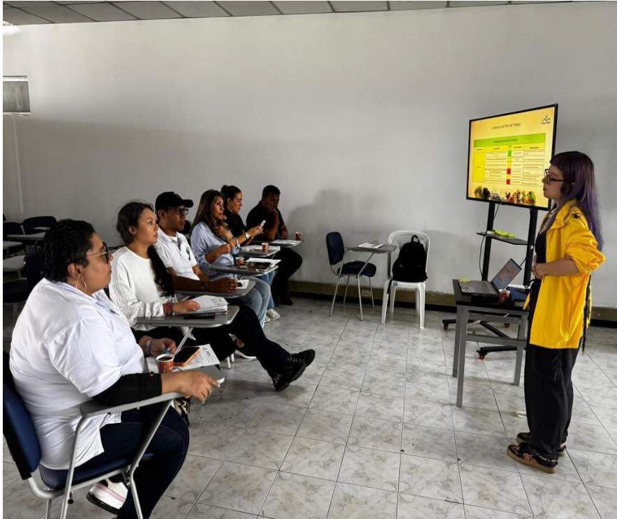
Imagen 8. Tercera reunión Equipo de Gestión Ambiental Institucional-EGAI