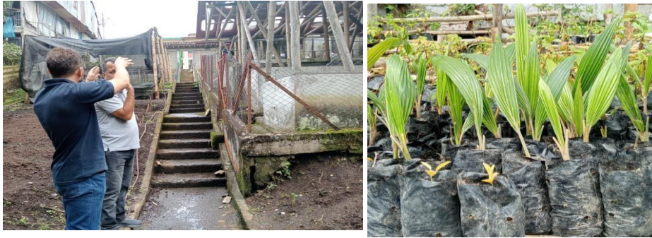
Imagen 11 y 12. Visita vivero La Palma Salamina.