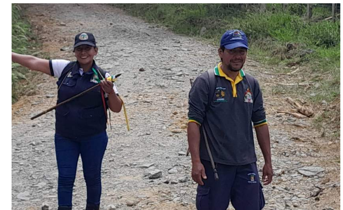
Autoridad Ambiental y solución de conflictos ambientales por medio del PORH de la quebrada Aguas Claras en la parcialidad Cartama.