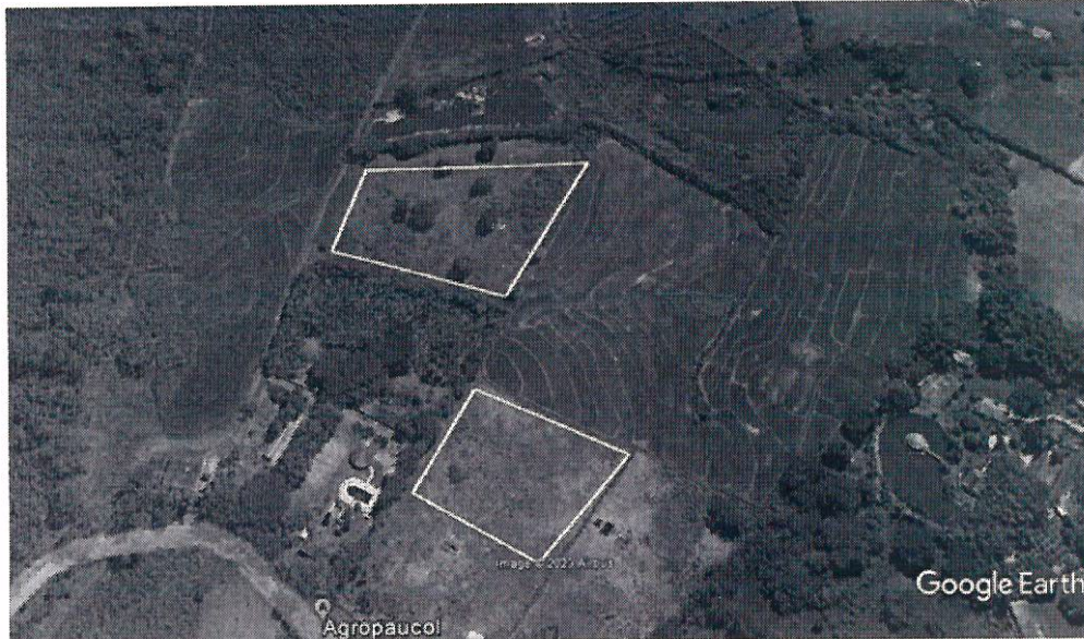
Figura 1. Localización del vivero Agropaucol Jamundí, Valle del Cauca.

"Por la cual se impone una medida preventiva en virtud de la facultad a prevención y se adoptan otras determinaciones"