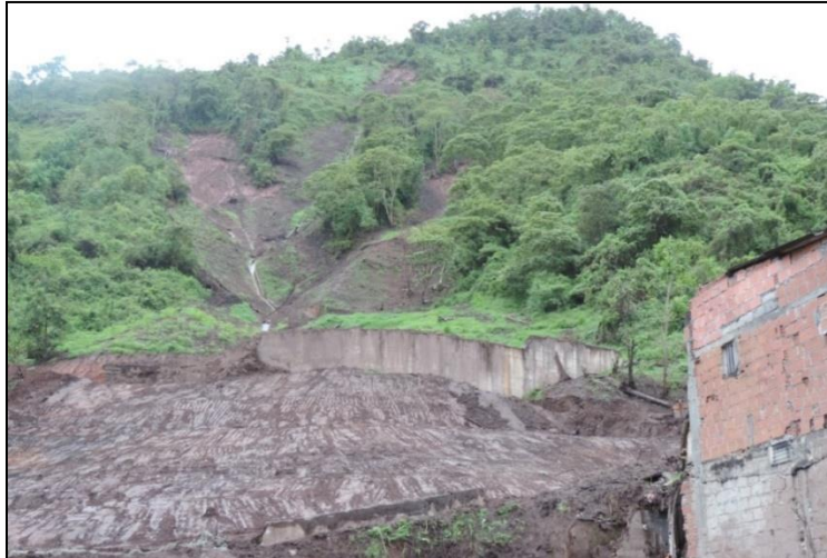
Figura 2. Imagen de la ladera del cerro afectada por los deslizamientos de tierra. Nótese la alta pendiente y la obra de retención de sólidos que fue construido años atrás como medida de protección. Gracias a ella muchos de los vecinos del sitio tuvieron oportunidad de salir de sus viviendas antes del segundo pulso del desprendimiento que la rebaso.