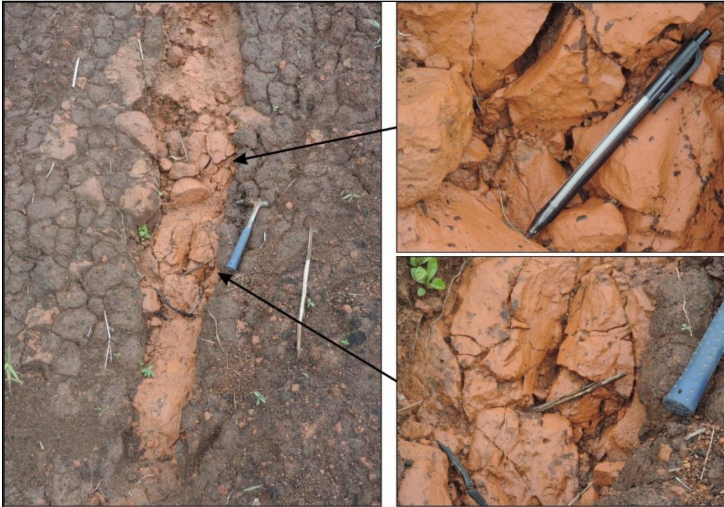
Figura 4. Detalles de los bloques de roca totalmente alterados pero conservando la imbricación y alguna cohesión. Por encima de estos bloques estaba la capa de arcilla que facilitó la generación de los deslizamientos.

El detonante de la generación de los deslizamientos fueron las fuertes precipitaciones que se presentaron en la zona, por lo tanto las obras que se requieren deben estar encaminadas a la captación y conducción de manera adecuada de las aguas de escorrentía hacia un cauce estable, o en su defecto al sistema de alcantarillado del barrio en los volúmenes que es recomendable hacerlo de acuerdo a las recomendaciones actuales de capacidad que llegan a periodos de retorno de 100 años más el 40% y a proveer un sistema de retención de sólidos en la ladera con el fin de que si en algún evento se produce un desprendimiento de tierras estas puedan ser contenidas por este sistema.